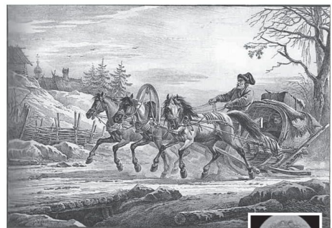
Настоящая кибитка — это крытая повозка, как на этой литографии Александра Орловского «Путешественник в кибитке, или Сани, запряжённые тройкой» (1819, Киевская картинная галерея)

Другие ученики назвали кибитку «птичкой», летящей с Кубы и крыльями поднимающей снег; «поездом, который очень быстро едет, и поэтому снег летит вверх и вниз» и даже «кибернетической, шустрой тёткой». Ямщик, по их мнению, оказался «кдадей, профессия которого — таскать ашкиски», человеком, роющим ямы, вероятно, карликом, «потому что сидит на чём-то маленьком и прячется в ямку».