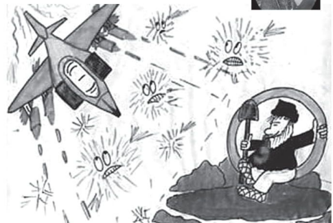
А вот таким детским «видением» браздов, ямщика и кибитки делаются друг с другом пользователи Интернета