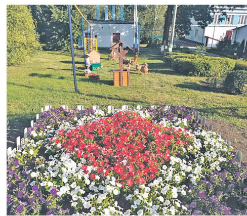
Старобезгинская школа Новооскольского городского округа