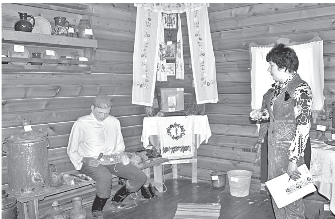
В школьном музее этнографии

НО ДАЖЕ САМОЕ КРАСИВОЕ, ПУСТЬ И ДОБРОЖЕЛАТЕЛЬНОЕ ОФОРМЛЕНИЕ МОЖЕТ СТАТЬ БЕСПОЛЕЗНЫМ, БЕЗДЕЙСТВЕННЫМ,