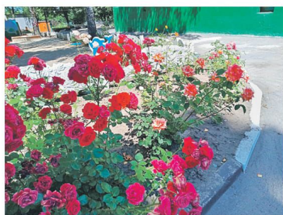
Детсад № 48 «Вишенка» г. Белгорода