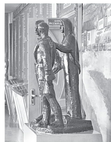
Школьный музей Великой Отечественной войны

Уверена в том, что в школе всегда ведущей и главной должна быть функция воспитания, ответственности за формирование человеческой личности. В детях необходимо формировать нравственные принципы, делая это незаметно и каждодневно. В нашей школе детей и педагогов связывают