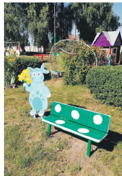
Детсад № 4 с. Алексеевка Корочанского района