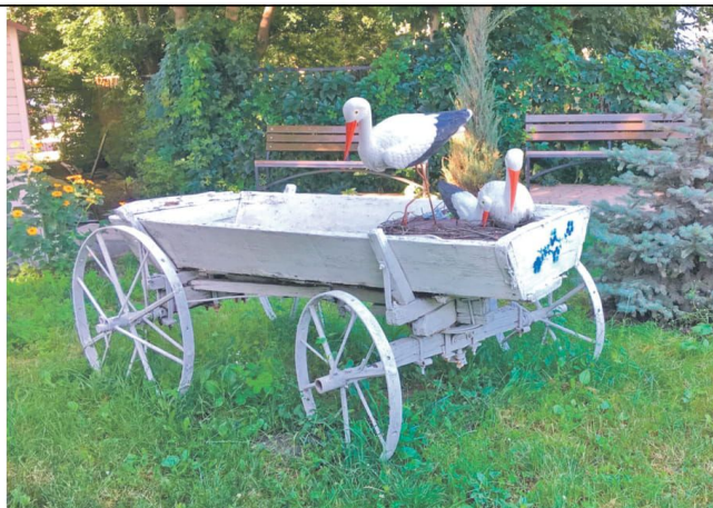
Центр образования № 1 г. Белгорода