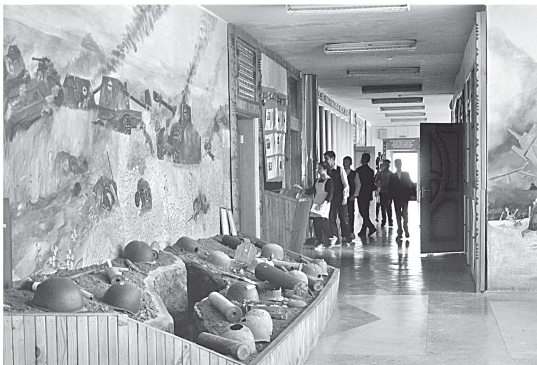
Школьный музей Великой Отечественной войны