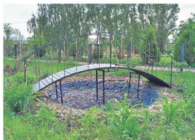
Уразовская школа № 2 Валуйского городского округа